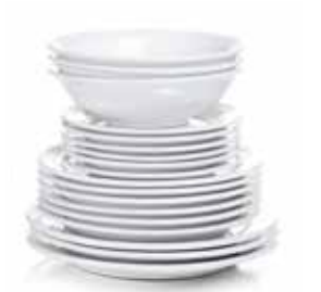
Piatti, Tazze, Tazzine