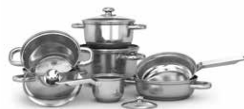
Pentole e Padelle