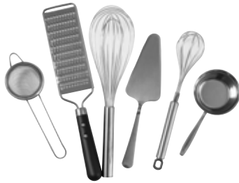
Piccoli utensili da cucina