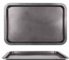
Teglie da forno