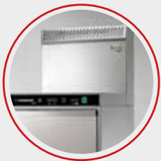
Recuperatore di calore Optional